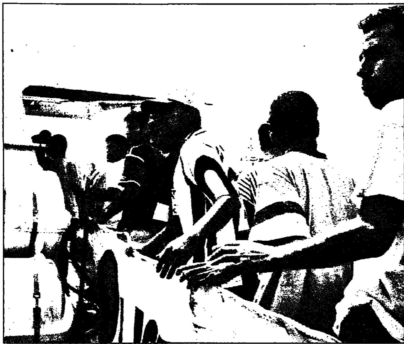
مهاجرون تونسيون غير شرعيين يصعدون إلى سفينة في ميناء تريباني في جزيرة صقلية الإيطالية استعداداً لترحيلهم إلى وطنهم